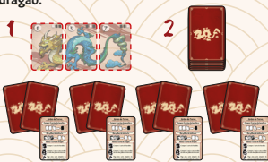
Preparação para 4 jogadores